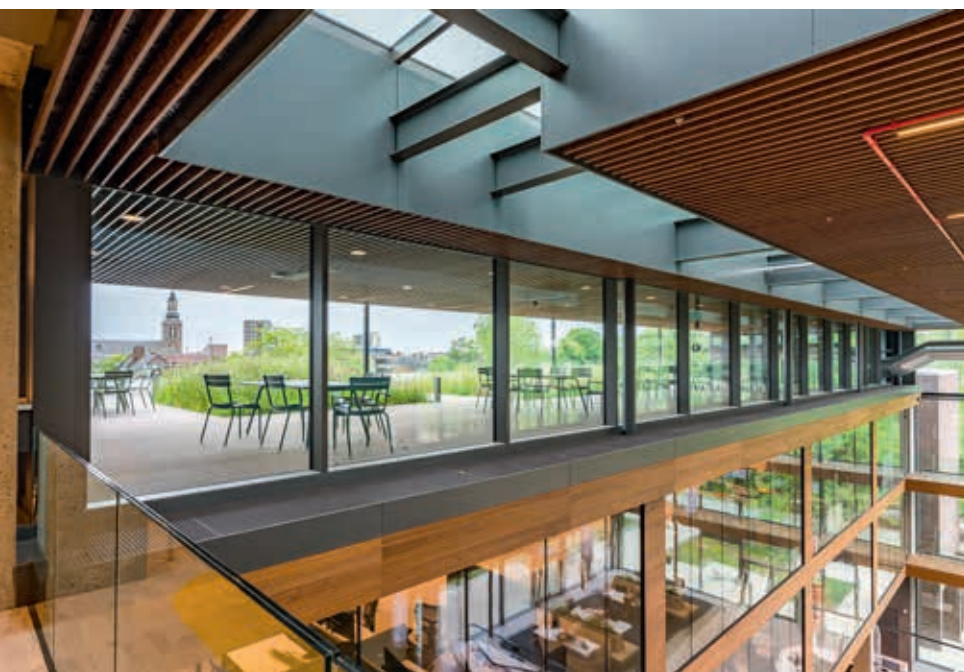
FOTO ONDER Voor de medewerkers is een prettige, eigentijdse werkomgeving gerealiseerd, met voldoende ruimte voor overleg en interactie.

FOTO RECHTSBOVEN Het vergadercentrum omvat ruimtes van verschillende omvang. Deze kunnen door medewerkers en raadsfracties gebruikt worden maar ook voor bijzondere bijeenkomsten.