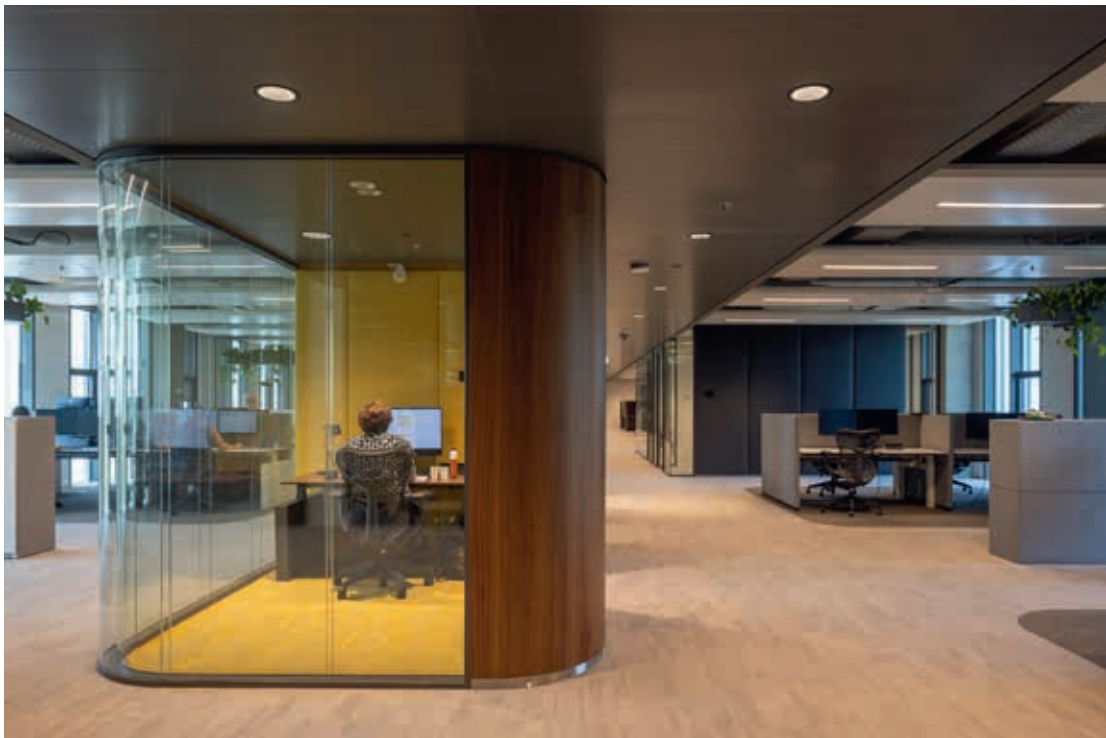
FOTO BOVEN Om vleugels niet te grootschalig te maken, zijn concentratiecellen gebruikt als ruimteverdeler.