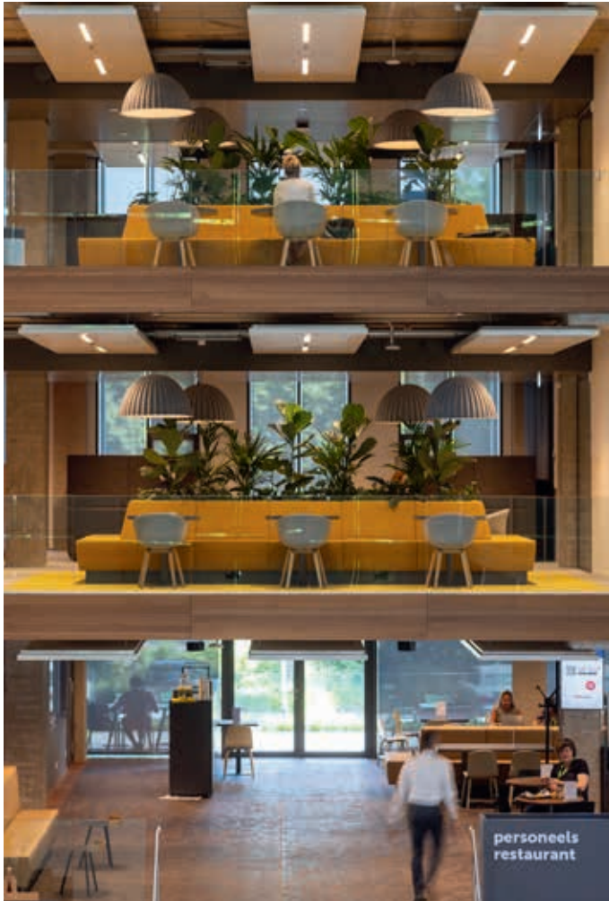
FOTO BOVEN De nieuwe publiekshal is door middel van een atrium ruimtelijk verbonden met de bovengelegen werkvloeren. Hierdoor opent het gebouw zich meteen bij binnenkomst.